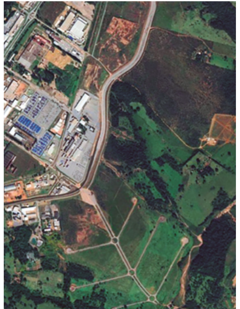
O DaiaPlam contará com 144 terrenos em um espaço de 1,7 milhão de m 2