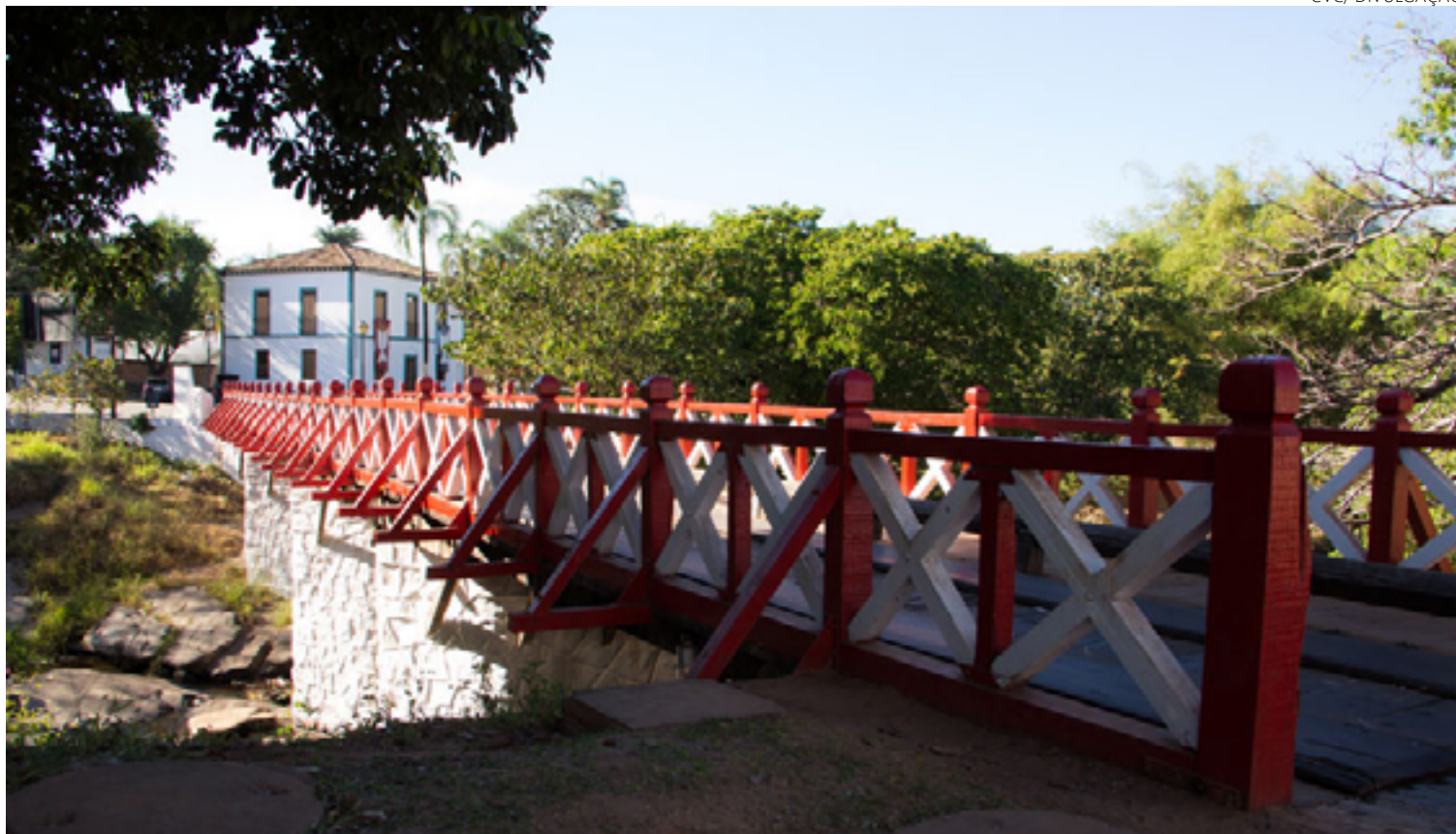
Sombra e água fresca: evento toma conta do Centro Histórico do município goiano