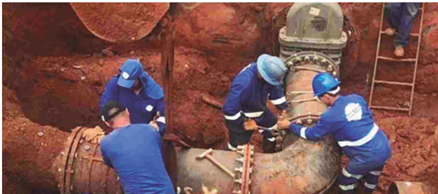
Serviços são de interligações e instalação de válvulas redutoras de pressão na rede de distribuição de água; se estendem até a próxima sexta, 8

As obras de quarta-feira, 6, ocorrem na Avenida Ana Jacinta, na Vila Santa Maria de Nazareth;