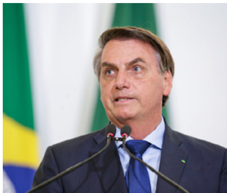
Jair Bolsonaro: devolução de objetos que recebeu em agendas oficial

Já a pistola e o fuzil que o ex-presidente recebeu de presente do regime dos Emirados Árabes, segundo a proposta feita pela área técnica do TCU, devem ser entregues pela Polícia Federal (PF) diretamente à Presidência.