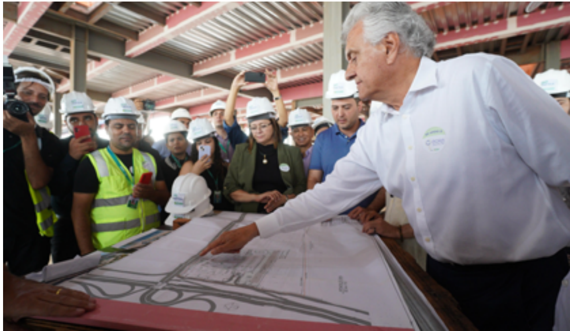
Governador Ronaldo Caiado apresenta obras do Cora para comunidade política: “Em 20 meses vamos ter este hospital pronto, uma obra 100% pública”

Nesta fase, destinada ao atendimento de crianças e adolescentes, o investimento será de R$ 180 milhões. Caiado ressaltou os padrões de excelência