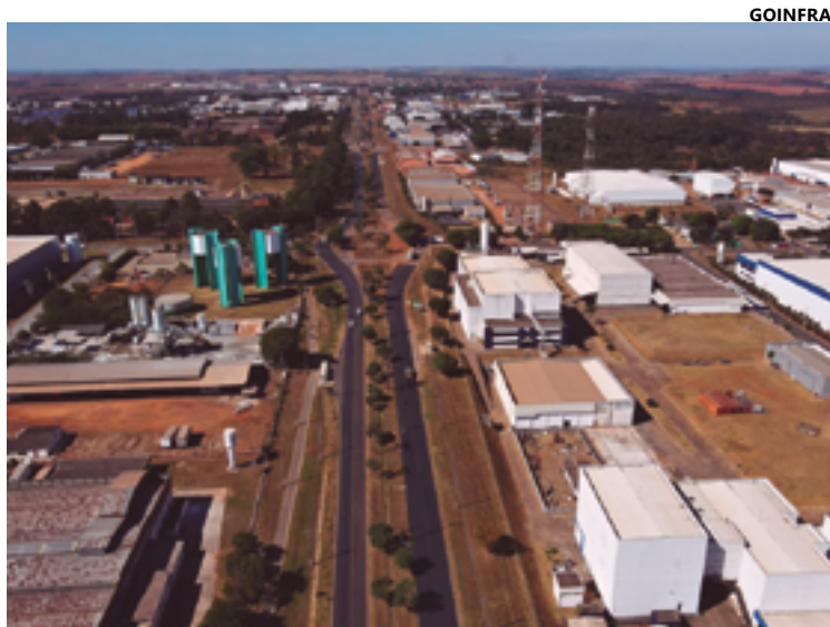
Parque industrial anapolino está em franco processo de crescimento

Deputados estaduais aprovaram texto de forma definitiva na terça-feira, 28, que versa sobre destinação de áreas de 54 hectares