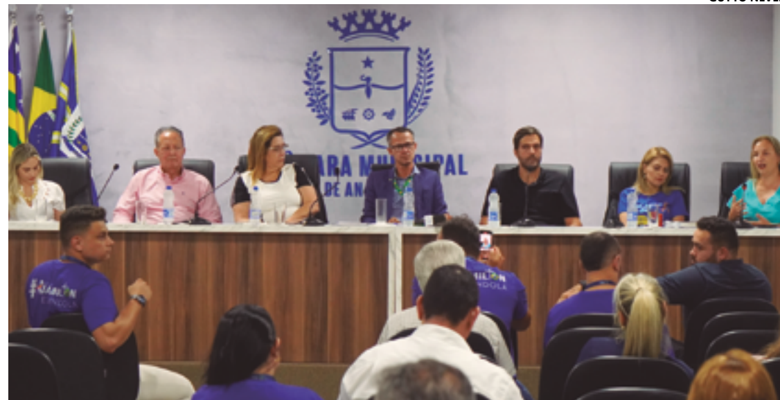
Tema urgente: IBGE mostra que 12 milhões de pessoas com deficiência estão fora da força de trabalho no país

Aurobindo Pharma Indústria Farmacêutica Ltda CNPJ: 04.301.884/0001-75 torna público que recebeu da Secretaria Municipal de Meio Ambiente de Anápolis - SEMMA, a Licença Ambiental de Funcionamento (LF) nº 741/2023, para atividade de Importação e Distribuição de Insumos Farmacêuticos e Medicamentos, localizada no endereço: Rua VP - 6E, Quadra 09, Lote 12/15, S/N, DAIA, CEP 75.132-135, Anápolis - Goiás. Com data de validade até 22/11/2027. Não foi determinado estudo de impacto ambiental.