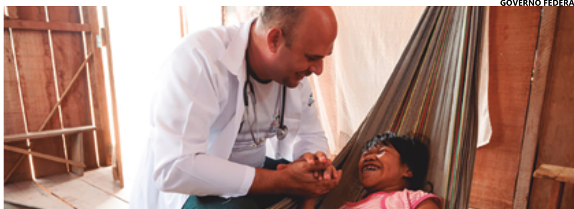
O tratamento de doenças crônicas e ações voltadas à atenção primária, são objetivos dessa área da medicina

Para avaliar os trabalhos realizados em 2023 e traçar estratégias de planejamento para 2024, a entidade promove um encontro dos profissionais que atuam na área, agendado para esta terça-feira, 5, data em que é comemorado o Dia Nacional do Médico de Famí-