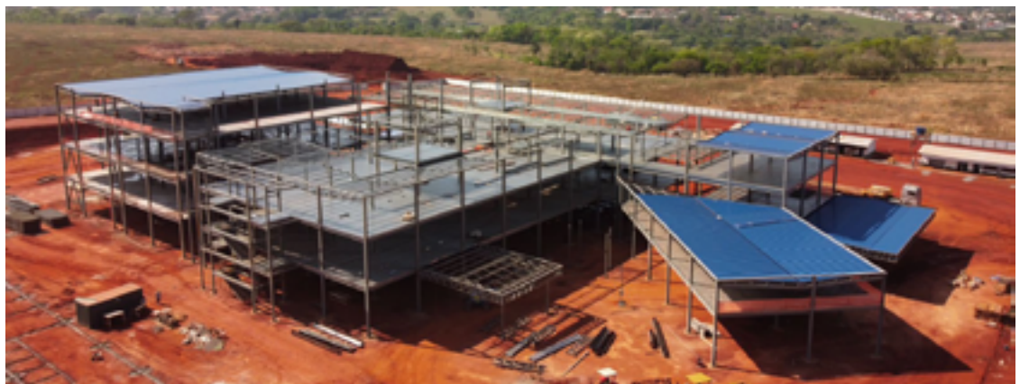
Governo de Goiás informa que mais de 40% dos serviços já estão concluídos