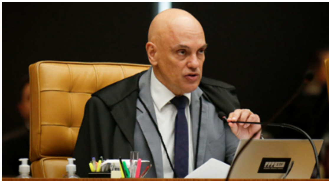
Alexandre de Moraes: combate à utilização da inteligência artificial com fins de desinformação

Segundo Moraes, em seminário promovido pela Fundação Getúlio Vargas (FGV), no Rio de Janeiro, o uso da IA no contexto político pode ampliar o alcance e o convencimento de eleitores por meio da desinformação. Por isso, a aplicação de punições, como cassação de candidaturas e de mandatos, seria importante para combater o problema nos próximos processos eleitorais. O ministro ainda voltou a dizer que as big techs – que administram as plataformas de redes sociais – devem ser submetidas a regulamentação.