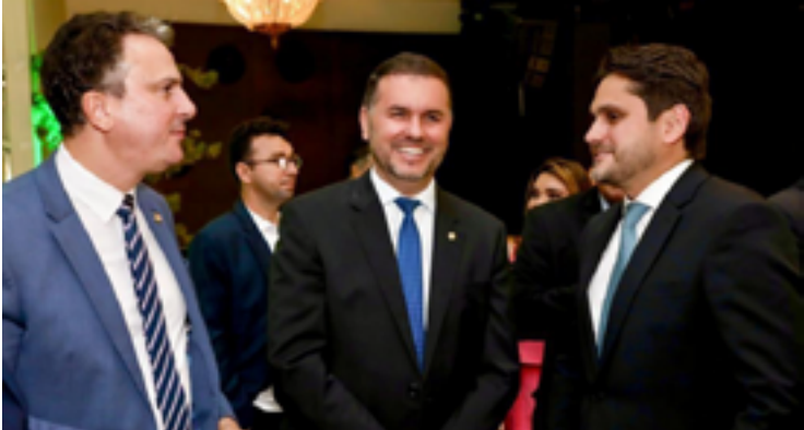
Em noite prestigiada por 200 convidados, a Associação dos Mantenedores Independentes Educadores do Ensino Superior – AMIES promoveu jantar de confraternização, em Brasília. O evento brindou um ano de resultados positivos para a instituição e contou com a presença de associados, representantes de instituições e autoridades dos poderes Executivo, Legislativo e Judiciário, entre eles os ministros da Educação, Camilo Santana, e das Comunicações, Juscelino Filho. Como anfitrião, o presidente da instituição, deputado Moses Rodrigues.