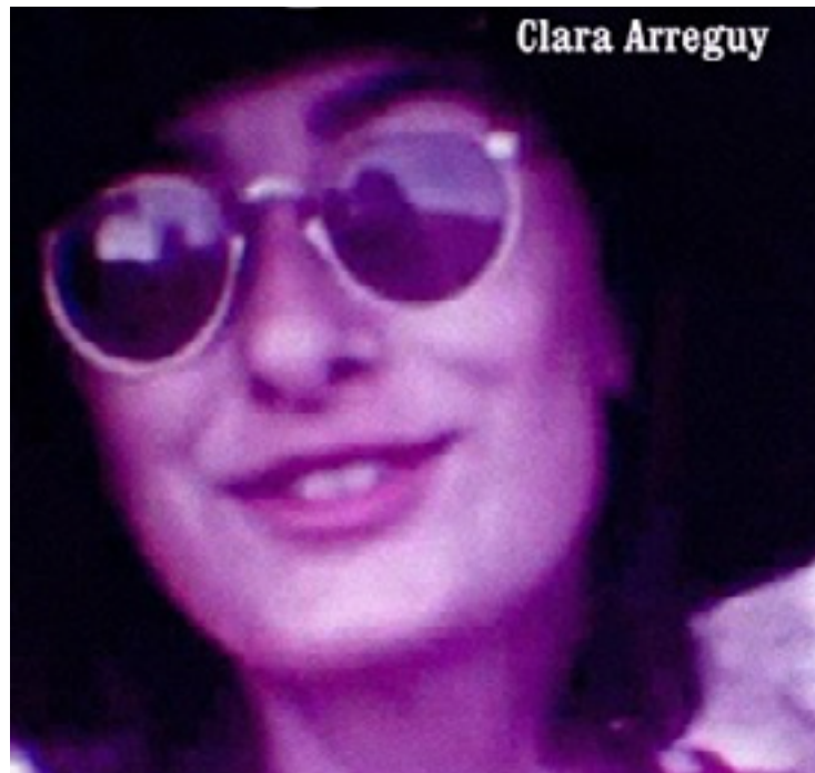
Capa do romance “1974”

e jornalista publicou quase três dezenas de livros. Vai do romance à biografia, das crônicas aos contos, dos livros infantis aos textos jornalísticos - eu sei, este último não possui nenhum compromisso com a forma, mas talvez você mude de ideia ao ler “A História da Mulher Silenciada pelo Sobrinho com um Rodo na Garganta”, reportagem assinada pela escritora-jornalista no “Metrópoles”. Há um atrativo verniz literário na maneira como os fatos são apresentados ao leitor.