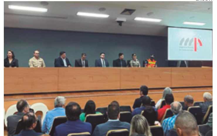
Mesa diretiva da solenidade de posse dos conselheiros de segurança pública, realizada nesta segunda-feira, 4, em Goiânia: fortalecimento

Eugia Pharma Indústria Farmacêutica Ltda CNPJ: 44.639.493/0001-80 torna público que recebeu da Secretaria Municipal de Meio Ambiente de Anápolis - SEMMA, a Licença Ambiental de Funcionamento (LF) nº 678/2023, para atividade de Importação e Distribuição de Medicamentos, localizada no endereço: Rua VP - 6E, Quadra 09, Lote 12/15, Bloco A, S/N, DAIA, CEP 75.132-135, Anápolis - Goiás. Com data de validade até 22/11/2027. Não foi determinado estudo de impacto ambiental.